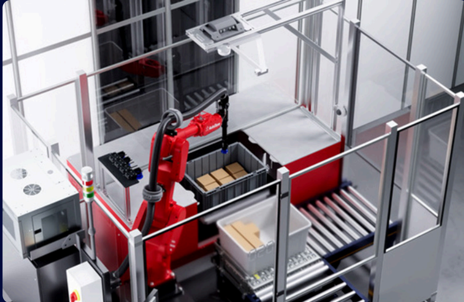
Carrousel AI

Fin septembre, nos équipes ont participé à l' AutoStore Consulting Day , une journée dédiée à la découverte des dernières innovations du fournisseur. L'événement comprenait notamment la visite du site La Fourche , épicerie bio en ligne (par ailleurs client Etyo) équipée d'un système AutoStore de 25 000 bacs et 128 robots .